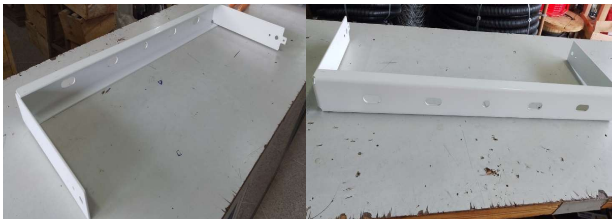
Figura 01 e 02 – Ilustração da chapa de aço do suporte a ser fabricado.

O item remunera o fornecimento de argamassa plástica com cimento e areia no traço 1:1 e a mão-de-obra necessária para a execução da regularização do piso com nata de cimento, aplicada com escova, vassoura ou rolo.