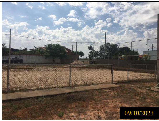
Figura 14: Local do empreendimento.