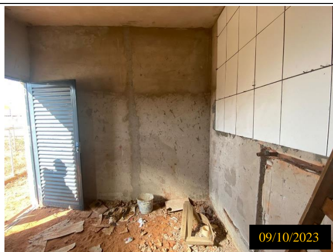
Figura 05: Local do empreendimento.