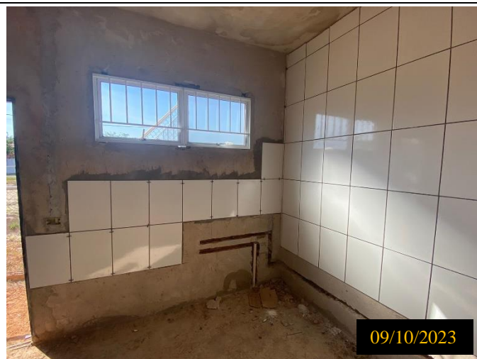
Figura 03: Local do empreendimento.