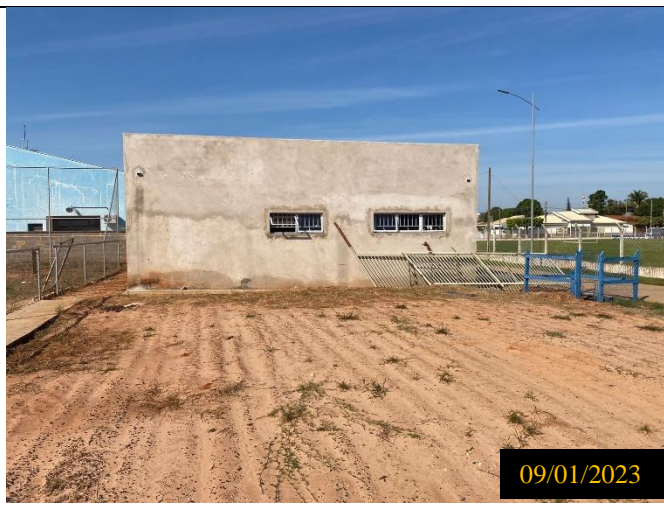
Figura 02: Local do empreendimento.