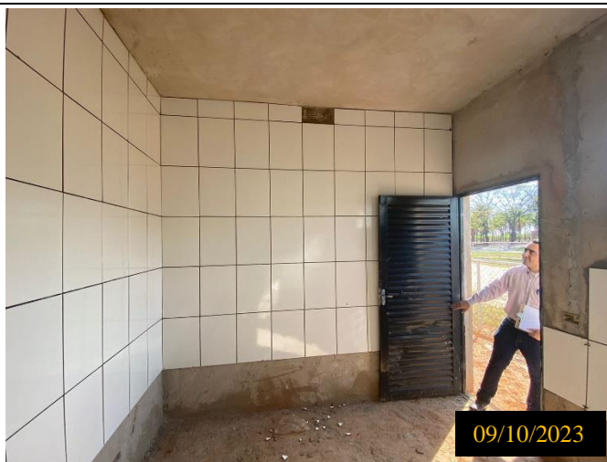
Figura 04: Local do empreendimento.