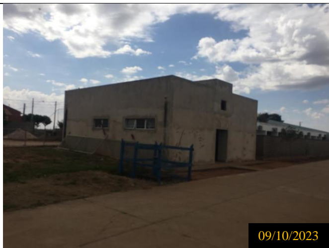
Figura 10: Local do empreendimento.