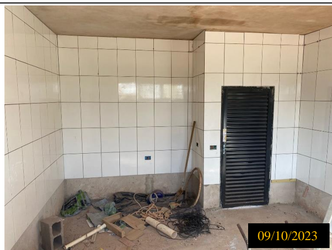
Figura 07: Local do empreendimento.