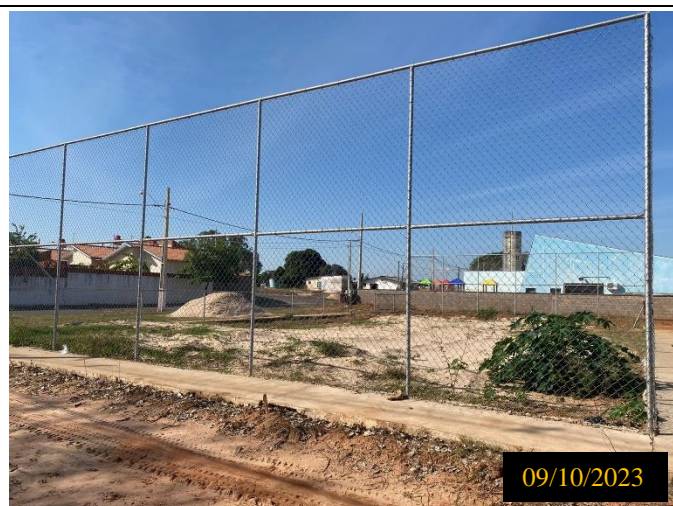
Figura 15: Local do empreendimento.