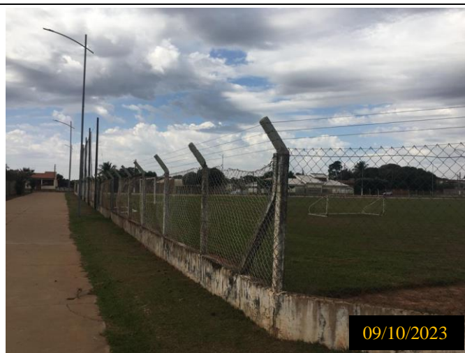
Figura 16: Local do empreendimento.