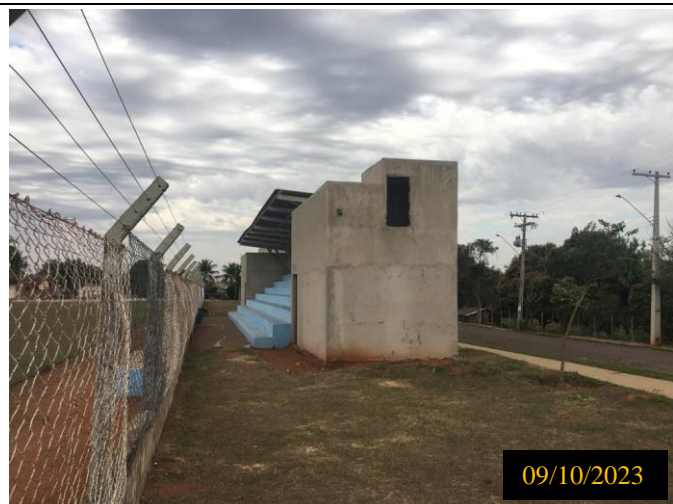
Figura 11: Local do empreendimento.