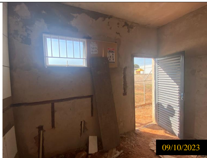
Figura 06: Local do empreendimento.