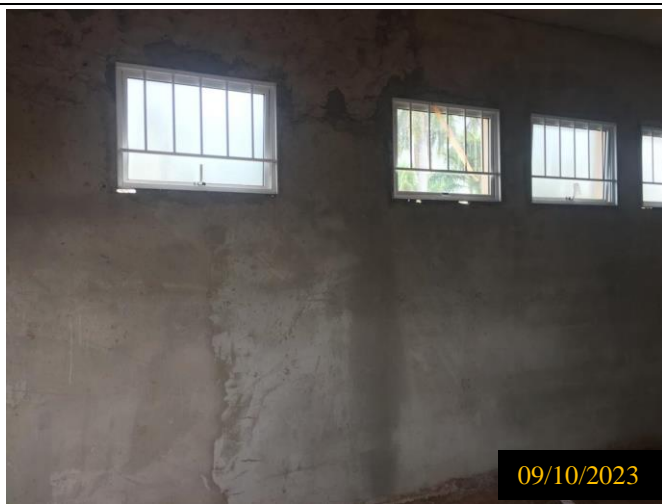
Figura 12: Local do empreendimento.