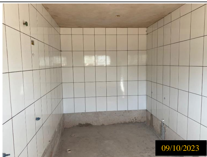
Figura 08: Local do empreendimento.