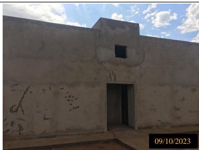
Figura 09: Local do empreendimento.