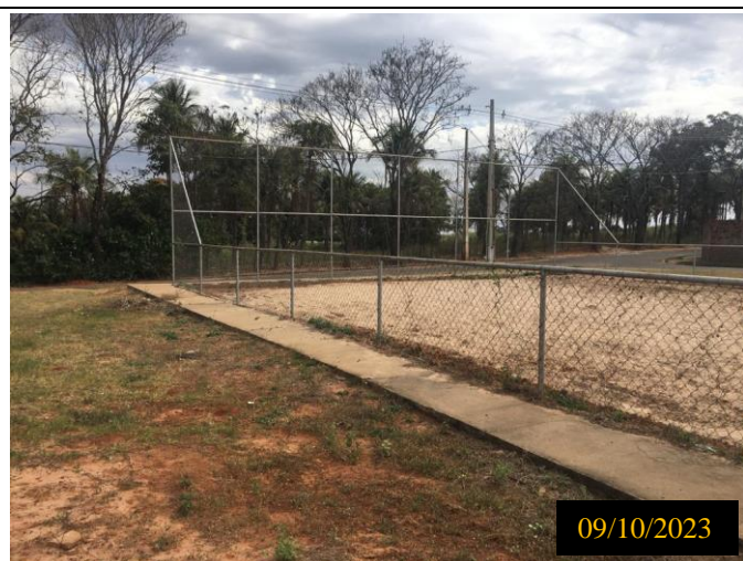
Figura 13: Local do empreendimento.